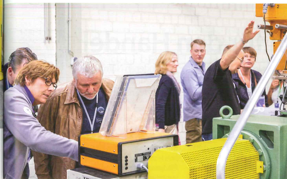
Da gibt's was zu sehen: Interessierte Gesichter beim Tag der offenen Tür.

das unter dem Begriff „Industrie 4.0“ zusammengefasst ist und die Informatisierung der Fertigungstechnik vorantreiben soll, wird in Methler bereits umgesetzt.