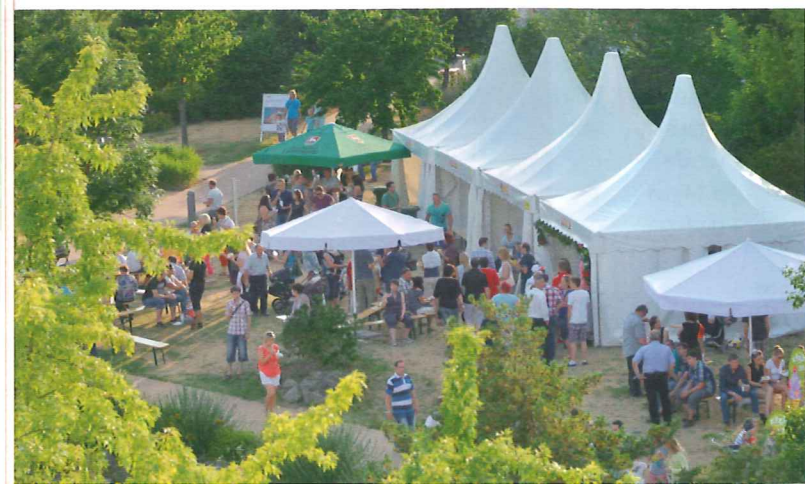
160 Jahre Firmengeschichte und die Einweihung des neuen Gebäudes: Zwei gute Gründe, um in Heroldsberg richtig zu feiern.