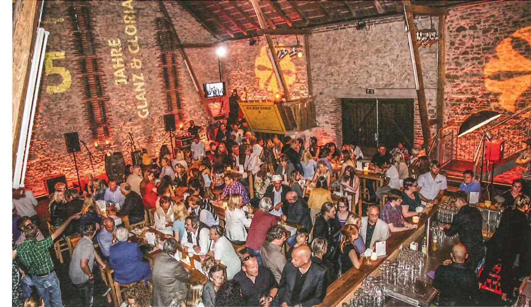
Modern Times stellte das Jubiläum unter das augenzwinkernde Motto „25 Jahre Glanz und Gloria“.