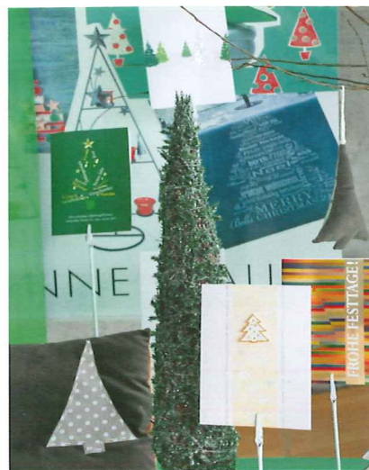
Fuchs, Sterne, Tannenbäume und Kerzen spielen eine zentrale Rolle bei den edlen ABC Weihnachtskarten.